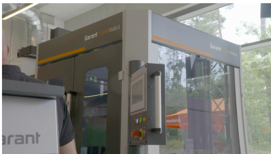
La Garant Turntable sert à l'automatisation de la finition